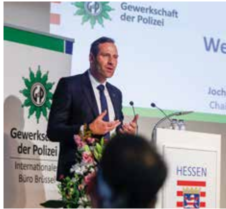
Der Bundesvorsitzender der GdP, Jochen Kopelke, eröffnete das Forum.

Weiterhin beinhaltet die EU-Übergangsregelung das Instrument der Vorratsdatenspeicherung, die es derzeit den Providern ermöglicht, in Fällen der Darstellung sexualisierter Gewalt an Kindern IP-Adressen zu speichern. Diese bilden zum Teil den einzigen Ermittlungsansatz zu Tätern. Andernfalls würden auch die vielen angelieferten Fälle des NCMEC an das BKA aufgrund des Zeitverzugs in der Übermittlung nicht verfolgt werden können. Diese EU-Übergangs-