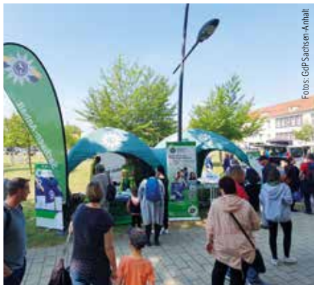
Unser Stand an der FH Polizei