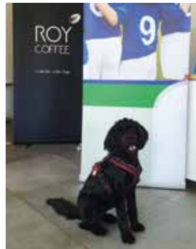
Auf den Hund gekommen! Fellnase Coco brachte moralische Unterstützung.

Im Technologiepark des Weinberg-Campus in Halle (Saale) findet man die Möglichkeit, Seminare auf eine etwas andere Art und Weise durchzuführen. Das Roy Coffee Hub wurde hierfür im Vorfeld als Location unter die Lupe genommen und für gut befunden. Nichts Wichtigeres als die Zukunft der Jugend im Land stand auf dem Tableau.