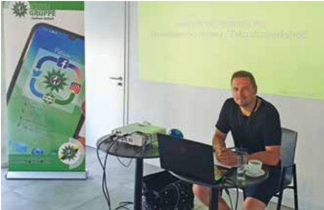
Unser Landesjugendvorsitzender in seinem Element