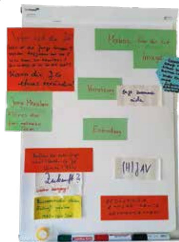
Mindmap & Brainstorming

Wenn sich junge Kolleginnen oder Kollegen, bestenfalls jünger als 30 Jahre, sich angesprochen fühlen, auf einer anderen Bühne etwas für die Beschäftigten in der Polizei Sachsen-Anhalt zu bewegen, dann kommt auf uns zu. Wir freuen uns auf Euch.