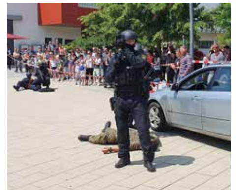
Ein Highlight sind jedes Jahr die Vorführungen der Spezialeinheiten.

Interessierte konnten sich an Teilen des Testverfahrens, z. B. dem Deutschtest sowie dem Intelligenzstrukturtest, ausprobieren. Hier setzen wir als GdP Sachsen-Anhalt an. Mit unserem Partner „Ausbildungspark“ geben wir Interessierten das beste Werkzeug