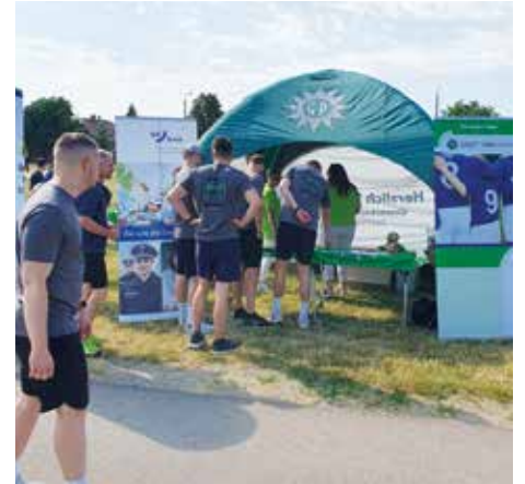
Unser Stand an der LBP.

freuen uns immer aufs Neue, wenn wir vom Dienstherrn eingeladen werden. Denn keine Veranstaltung ist wie die andere, und es macht uns riesigen Spaß, neue Gesichter kennenzulernen und Erfahrungen auszutauschen.