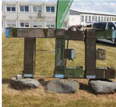
Sehen wir hier eine Einheit der Landesbereitschaftspolizei oder ein berühmtes englisches Nachmittagsgetränk?

das sich am gleichen Tag für eine Mitgliedschaft entschied. Sie sagte, sie wechselt nun zu uns, denn wir seien immer da und immer zu sehen. Liebes Neumitglied, wir